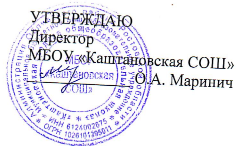
График эвакуации МБОУ «Каштановская СОШ» на 2022-2023 учебный год